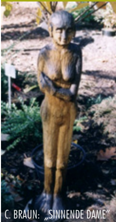
C. BRAUN: „SINNENDE DAME“